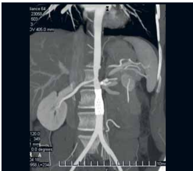
Рис. 3. Та же пациентка: визуализация стентов при проведении компьютерной томографии

ание после стентирования брюшного отдела аорты, почечных артерий слева в 2010 г.; стеноз сонных артерий справа и слева, стеноз плечеголового ствола и правой подключичной артерии); недостаточность аортального клапана 2-й степени, вторичная артериальная гипертензия, хроническая сердечная недостаточность I стадии, функциональный класс II.