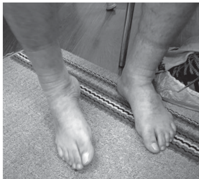
Рис. 1. Эквиноварусная динамическая дистония стопы у двух мужчин, больных токсической дезоморфиновой энцефалопатией.