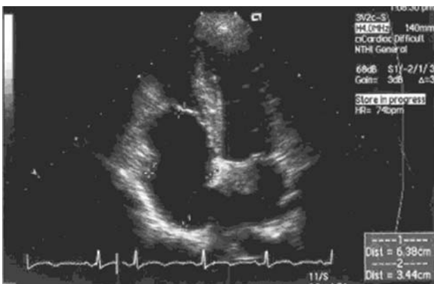
Рис. 1. ЭхоКГ больной М. (апикальная четырехкамерная позиция). На рисунке показана атриализованная часть ПЖ и смещение септальной створки ТК.

Диагноз АЭ подтвержден при проведении трансторакальной эхокардиографии (рис. 1). Из апикальной четырехкамерной позиции визуализировалось смещение задней и септальной створок трикуспидального клапана к верхушке ПЖ на 2,5 см с образованием атриализованной части ПЖ, выраженная дилатация ПЖ (6,3 × 3,5 см), асимметричная гипертрофия ПЖ. Диагностированы признаки объемной перегрузки ПЖ, трикуспидальная регургитация 2-3-й ст. Систолическое давление в легочной артерии в пределах нормы. Незначительная митральная регургитация 1-й ст., удлиненная заслонка нижней полой вены. Фракция изгнания – 75%, конечный диастолический размер ЛЖ – 3,3 см, конечный систолический размер