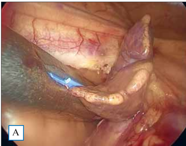
Рис. 1. Интраоперационная фотография: захват основания ушка левого предсердия сшивающим аппаратом (А); культя ушка левого предсердия (Б)