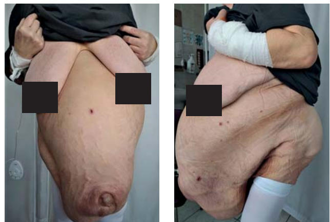
Рис. 1. Общий вид пациентки при поступлении.

Анамнез жизни: беременностей 5, из них родов — 1, аборт — 4. Рост 155 см, масса тела 109 кг, индекс массы тела 45,4 кг/м 2 . Самостоятельно больная передвигаться не могла из-за огромного объема опухоли.