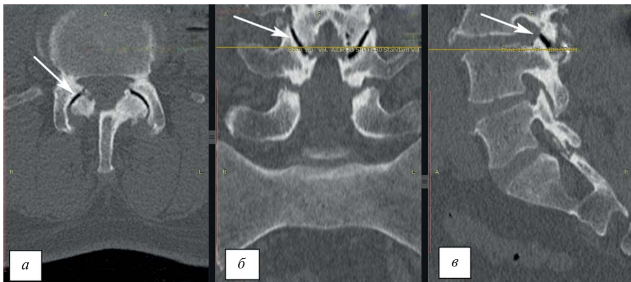
Рис. 2. Мультиспиральная компьютерная томография поясничного отдела позвоночника: а — аксиальная проекция; б — фронтальная проекция; в — сагитальная проекция. Стрелками указан гипертрофированный дугоотростчатый сустав L_{III} – L_{IV} справа с явлением «вакуум-эффекта».

Fig. 2. Multispiral computed tomography of the lumbar spine: а — axial projection; б — frontal projection; в — sagittal projection. The arrows indicate the hypertrophied zygapophyseal L_{III} – L_{IV} joint on the right with the phenomenon of the “vacuum effect”.