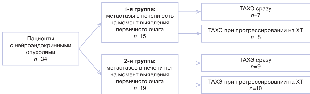
Рис. 1. Дизайн исследования.

Примечание. ТАХЭ — трансартериальная химиоэмболизация печеночных артерий; ХТ — химиотерапия.