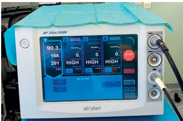
Рис. 3. Радиочастотный генератор Stryker Interventional spine MultiGen RF Console (США).

Вместе с тем, согласно данным иностранных источников, лучшие результаты в контексте эффективности и безопасности с оценкой по ВАШ, Harris Hip Score, WOMAC, OME, OHS отмечаются