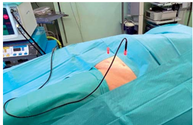
Рис. 4. Радиочастотная денервация запирающего и бедренного нервов.

Fig. 3. A Stryker Interventional spine MultiGen RF Console Radio frequency generator (USA).