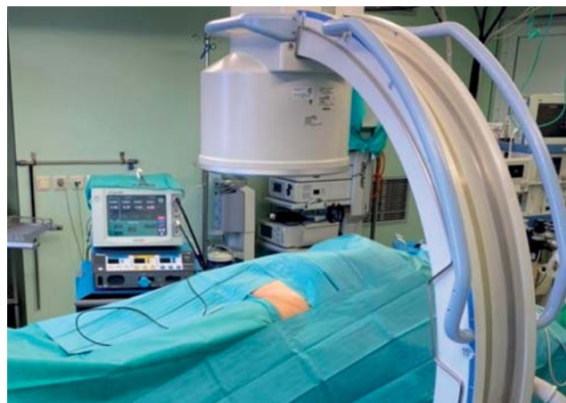
Рис. 2. Положение пациента на операционном столе.

Fig. 2. Position of the patient on the operating table.