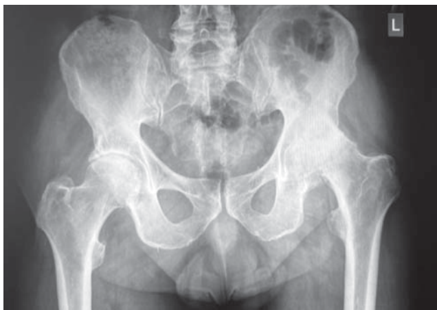
Рис. 1. Рентгенограмма тазобедренных суставов.

На момент первичного осмотра передвигался самостоятельно, прихрамывая на левую нижнюю конечность с дозированной опорой на трость под противоположную конечность. Движения в левом тазобедренном суставе резко болезненны, ограничены: сгибание 90°, разгибание 10°, отведение 5°, внутренняя и наружная ротация до 10°. Относительное укорочение левой нижней конечности 2 см.