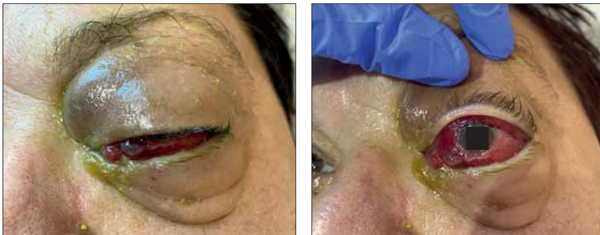
Рис. 2. Злокачественный отечный экзофтальм Грейвса. Хемоз, офтальмоплегия.