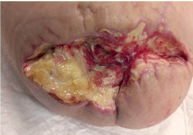
Рис. 3. Тот же пациент: вид раны в области ампутационной культи через 1,5 мес.

Fig. 2. The same patient: a wound in the area of the right lower limb stump (amputation at the level of the middle third of the thigh), the initial wound appearance.