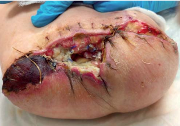
Рис. 2. Тот же пациент: первоначальный вид раны в области культи правой нижней конечности на уровне средней трети бедра.

Fig. 2. The same patient: a wound in the area of the right lower limb stump (amputation at the level of the middle third of the thigh), the initial wound appearance.