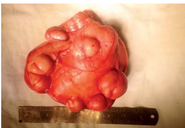
Рис. 2. Макроскопическая картина липомы

Дифференциальную диагностику ретроперитонеальной липомы следует проводить с неорганными забрюшинными опухолями другого гистогене-